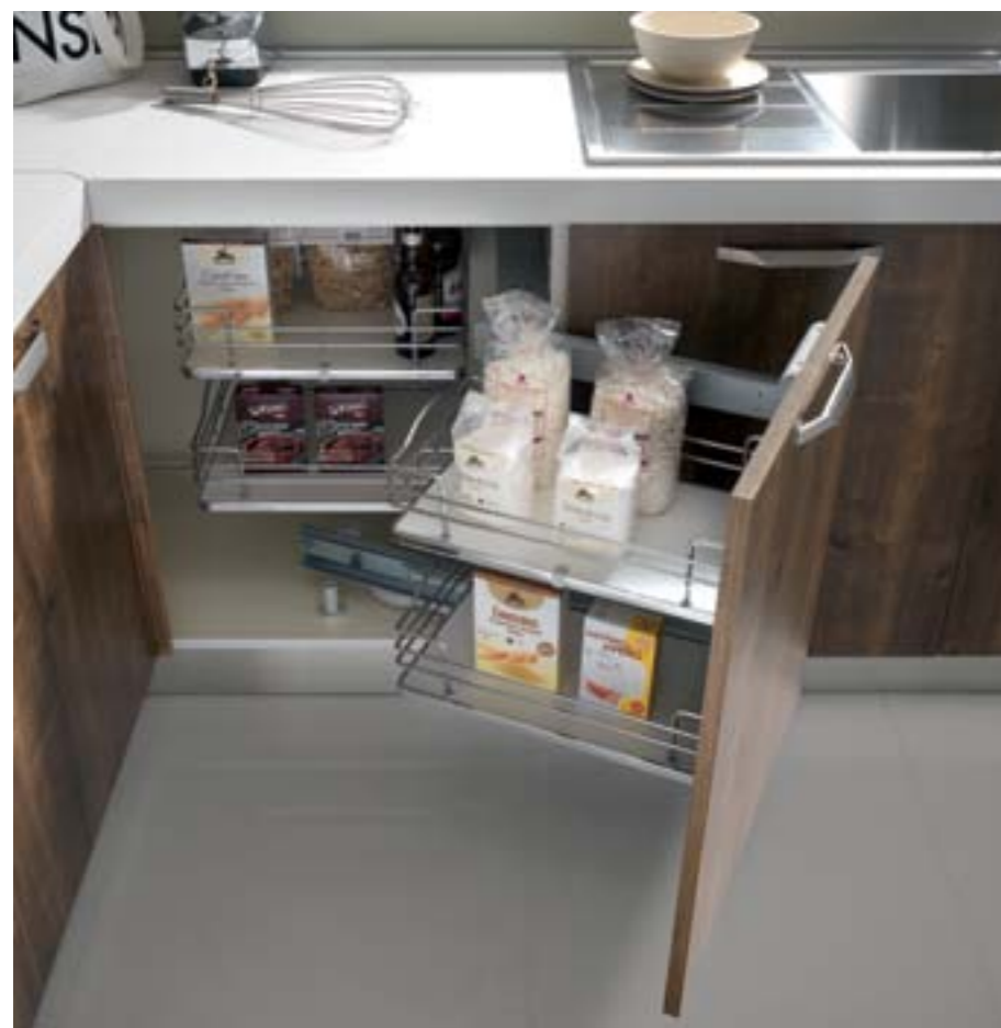
Nuovo meccanismo "Magic" per basi ad angolo con chiusura soft nella nuova finitura Rovere marrone. New mechanism Magic for corner cabinets with a soft closing in the new brown oak finishing.