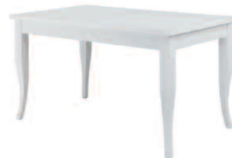
Tavolo modello MERANO frassino bianco_ pratico dalle forme essenziali