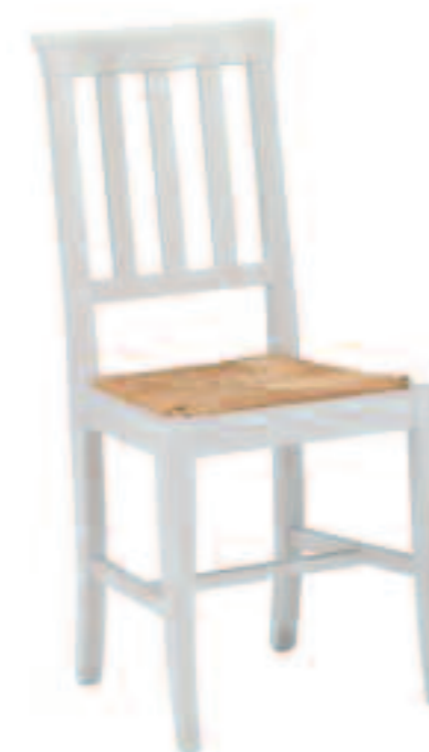
Sedia modello MERANO frassino bianco e fondino in impagliato