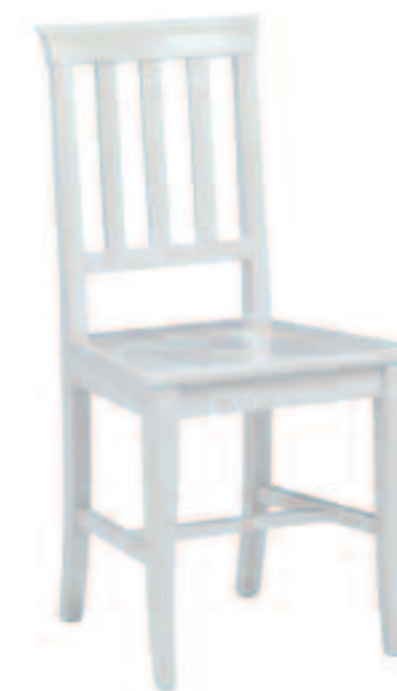
Sedia modello MERANO frassino bianco e fondino in legno