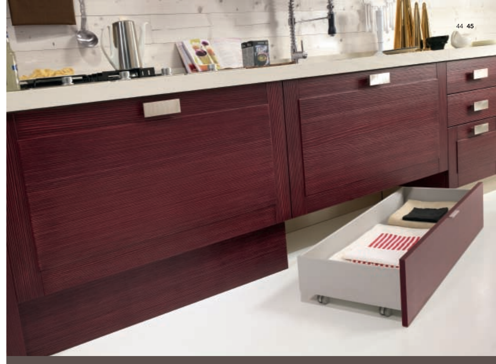
ELEGANTI BASI SOSPESSE ALTEZZA CM 60 CON LA POSSIBILITÀ DI INSERIRE PRATICI CESTONI CON RUOTE PER SFRUTTARE OGNI SPAZIO. ELEGANT SUSPENDED BASE UNIT 60 cm. HIGH, WITH THE OPTION OF INSERTING PRACTICAL PULL-OUTS ON WHEELS TO USE ALL POSSIBLE SPACE.