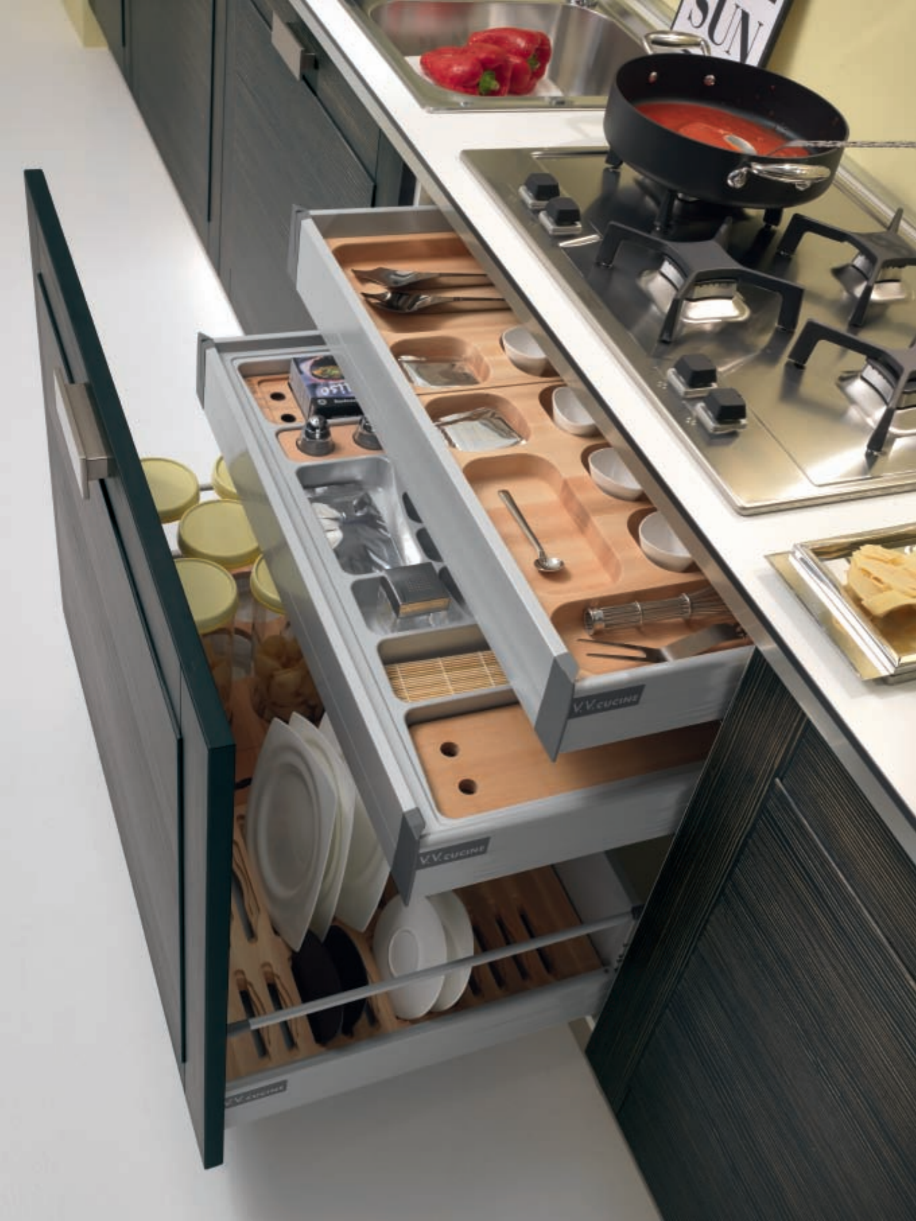
PARTICOLARE DELLA BASE A CESTONE DI ALTEZZA cm. 72 CON CASSETTO INTERNO E CASSETTO OPTIONAL. ANCHE LA BASE LAVELLO L. cm. 90 PUÒ ESSERE AD ANTA UNICA. DETAIL OF THE BASKETS BASE UNIT HIGH 72 cm. WITH INNER DRAWER AND OPTIONAL SECOND DRAWER. EVEN THE 90 cm. SINK BASE UNIT CAN HAVE A SOLID DOOR.