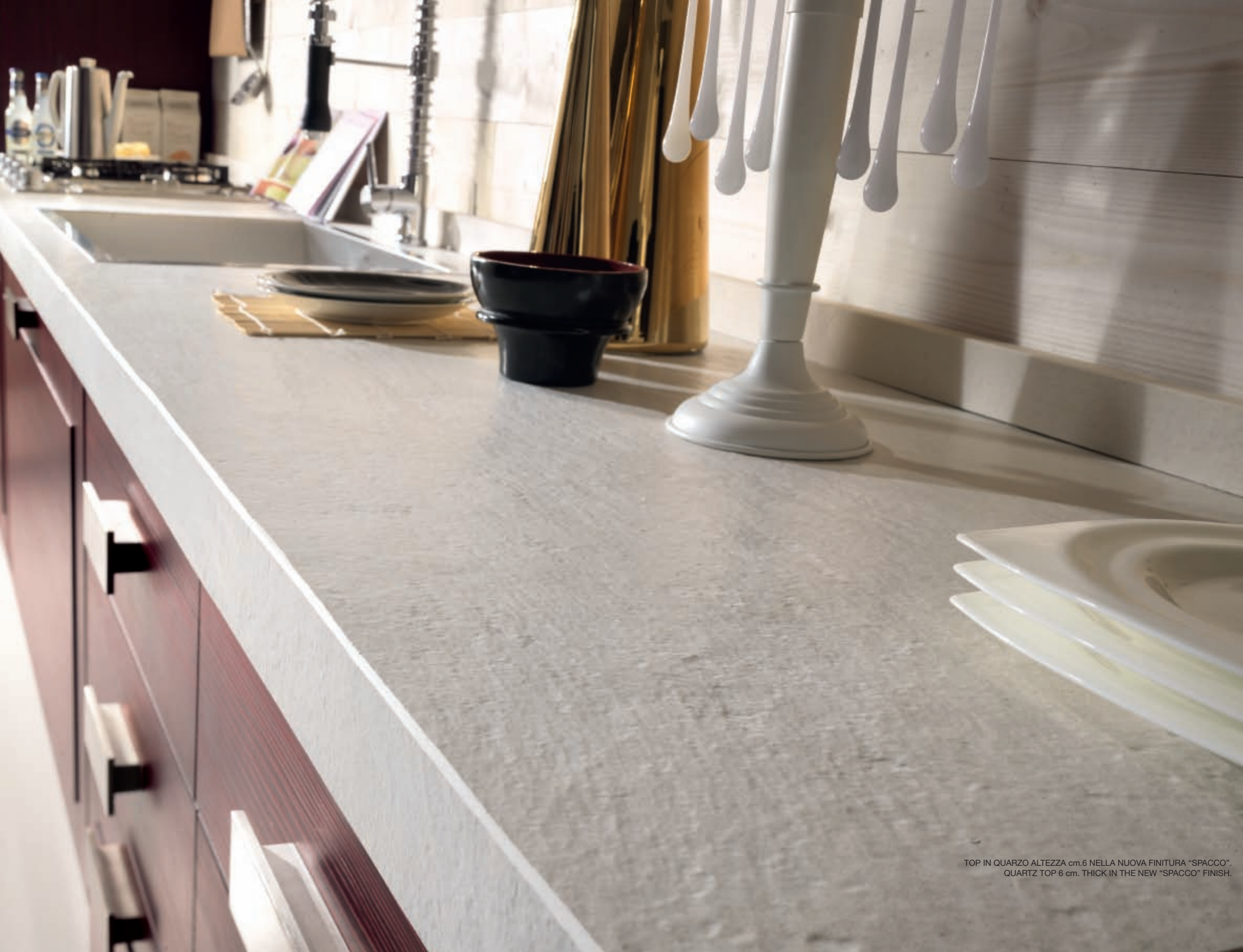
TOP IN QUARZO ALTEZZA cm.6 NELLA NUOVA FINITURA "SPACCO". QUARTZ TOP 6 cm. THICK IN THE NEW "SPACCO" FINISH.